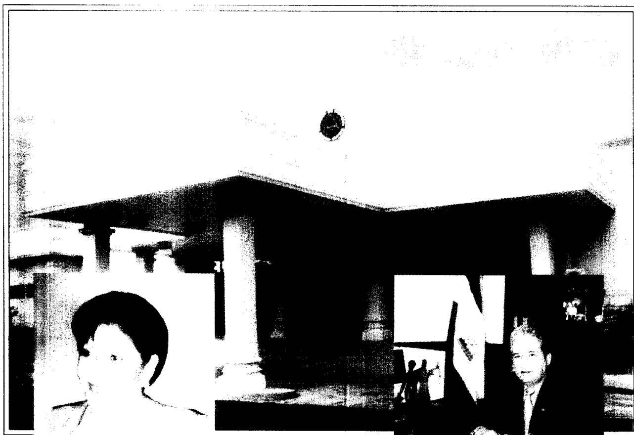
Dra. Alba Luz Ramos Vanegas Magistrada Presidenta Corte Suprema de Justicia