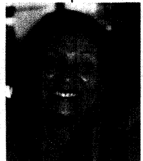
DOCTORA JOSEFINA RAMOS MENDOZA Presidenta de la Sala de lo Constitucional.