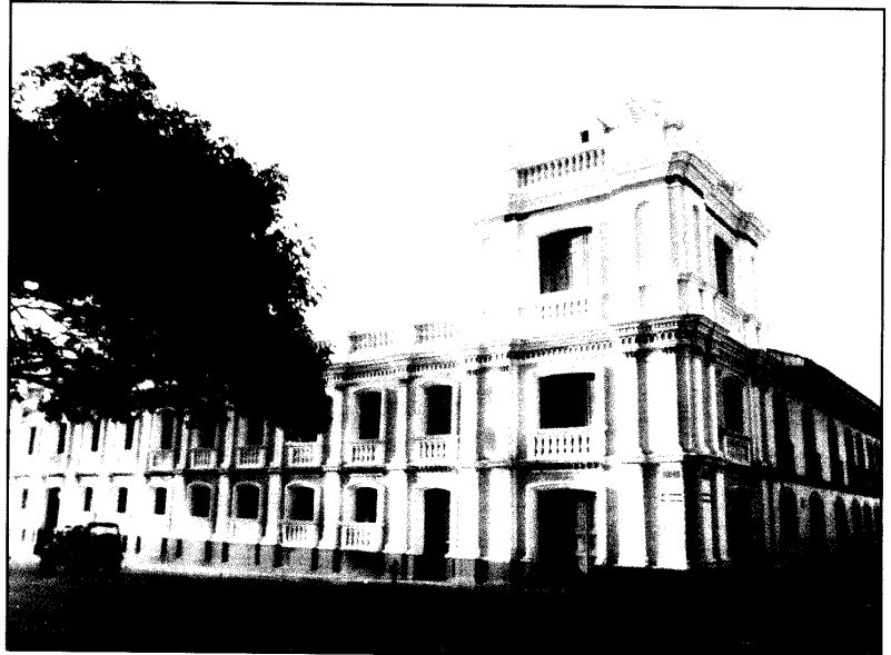
Palacio de Justicia de Buga, sede del Tribunal Superior del Distrito Judicial de Guadaluajara de Buga, el cual celebró 150 años de su creación en 1998.

Oficina de Comunicación y Prensa Carrera 7a. No. 27-18 piso 12 Tel: 3418232 Fax: 2847094 http://www.fj.edu.co/ (Publicaciones de la Rama Judicial) Santafé de Bogotá D.C. - Colombia