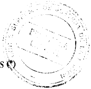
TABLE DES MATIERES – CONTENTS (*)